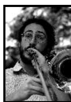
Galaad, trombone à coulisse, chœurs